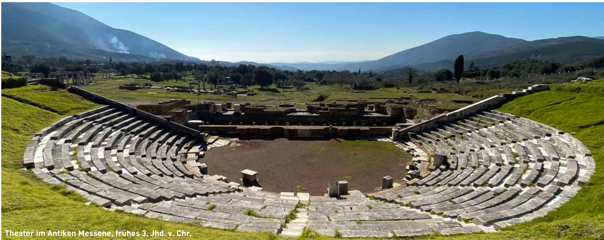
Theater im Antiken Messene, frühes 3. Jhd. v. Chr.