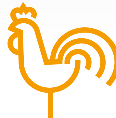
Ihr Günter Titsch