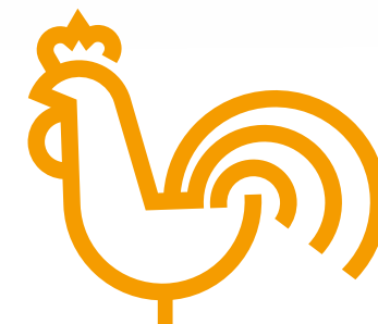
Ваш Гюнтер Тич

Мы рады возможности приветствовать Вас в Риге! Давайте споем вместе в Риге в 2017 году!