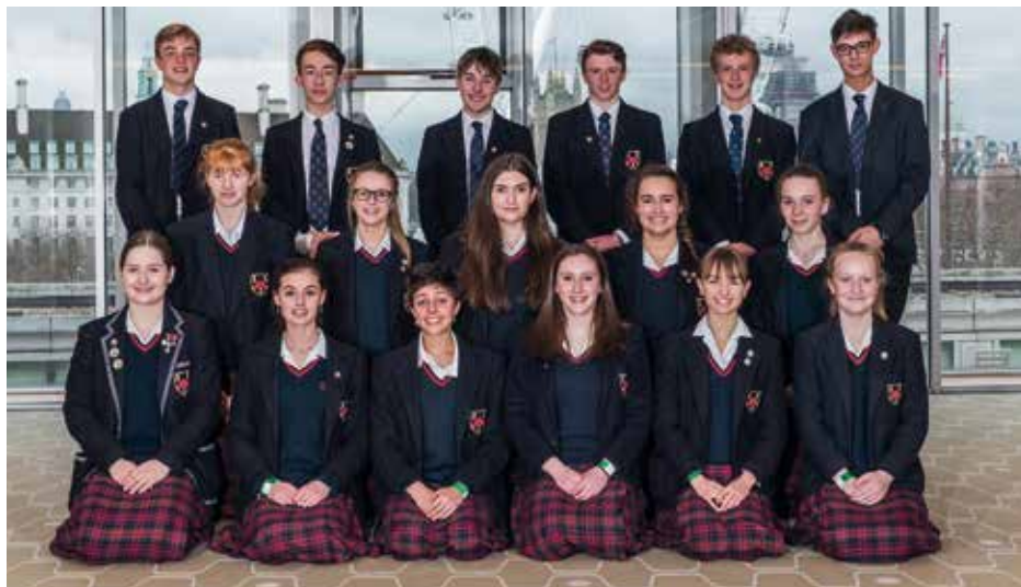
MOUNT KELLY COLLEGE CHOIR Great Britain, Tavistock