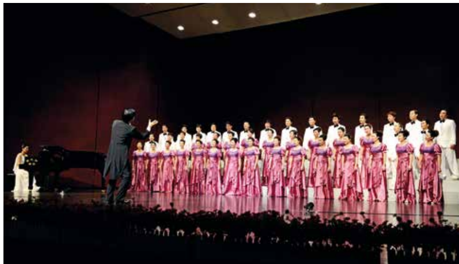
HAIKOU QIONGSHAN SEA RHYTHM CHOIR China, Haikou