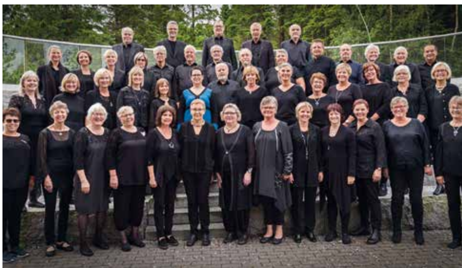
KOR É VI Norway, Bergen