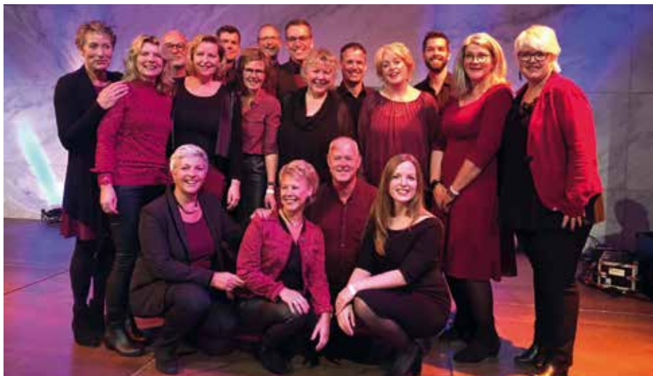
VOCAL GROUP FLEVOX Netherlands, Emmeloord