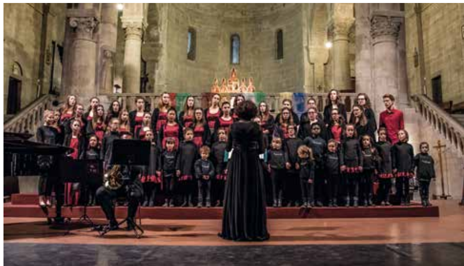
CORO VOCEINCANTO Italy, Arezzo