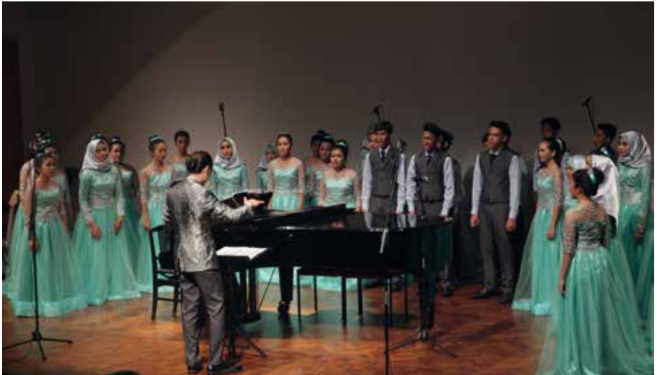
FABAVOSSA YOUTH CHOIR Indonesia, South Jakarta