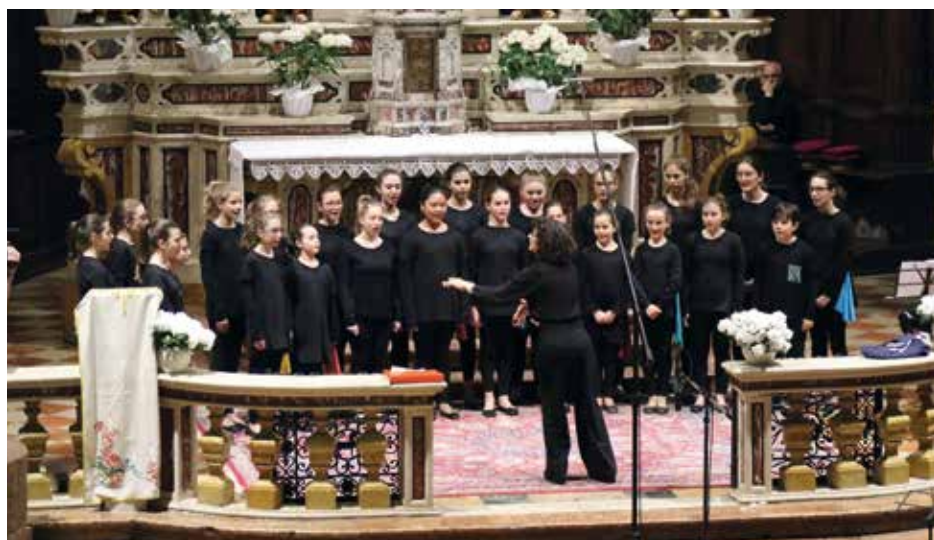
CORO VOCI BIANCHE VOCEINCANTO Italy, Arezzo