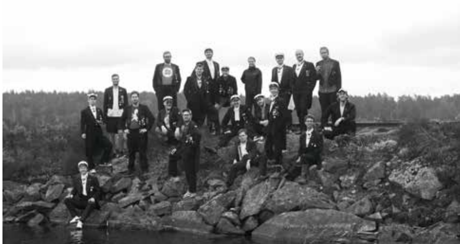
VÄSTGÖTA NATIONS MANSKÖR KORGOSARNA Sweden, Uppsala