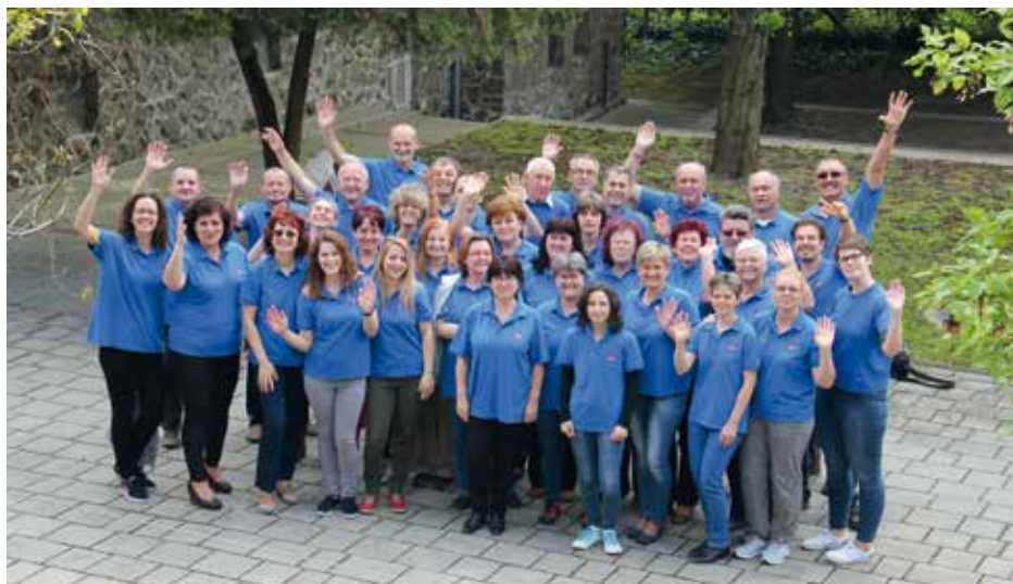
MIXED CHOIR OF PAKS Hungary, Paks