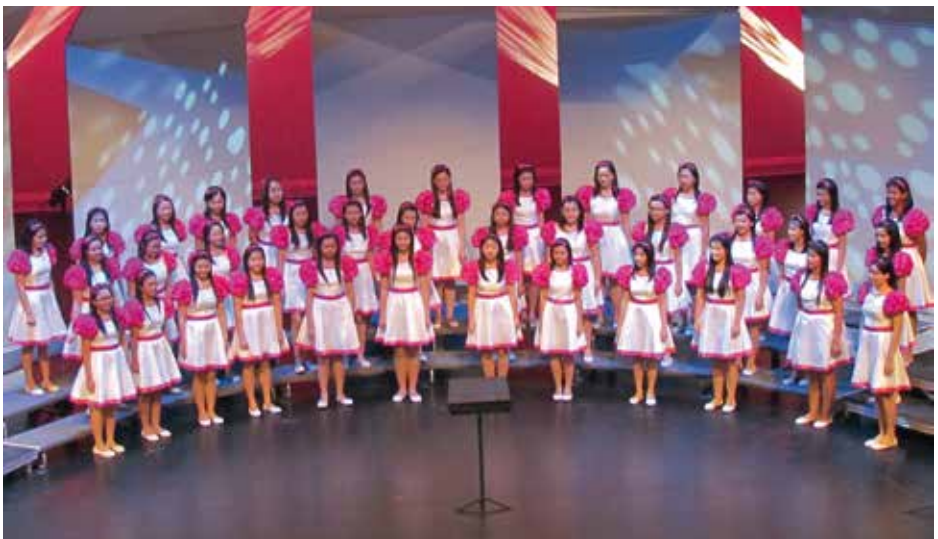
KARANGTURI CHOIR Indonesia, Semarang