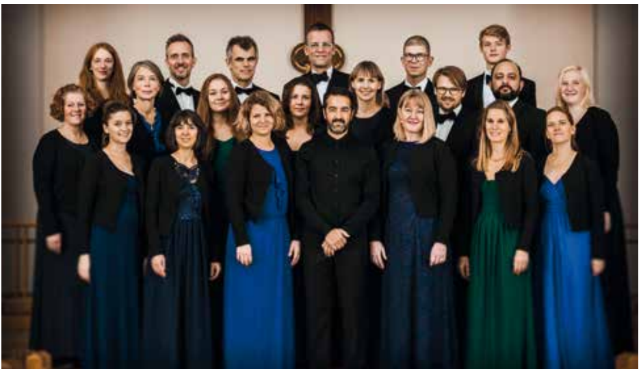
KAMMERKORET MUSICA Denmark, Copenhagen