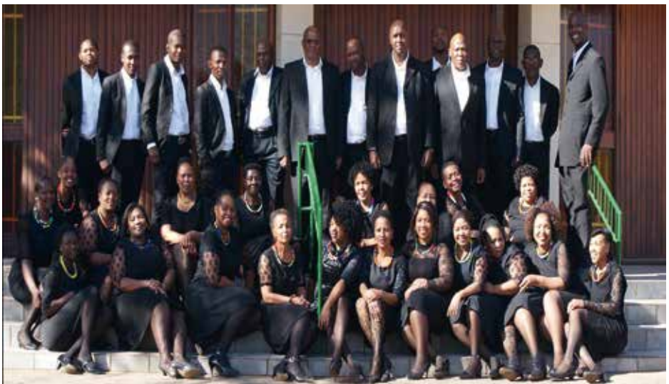
URCSA LIGHT OF HOPE CHOIR South Africa, Ekurhuleni