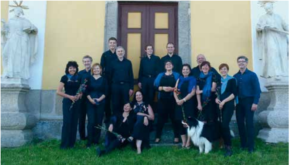
PĚVECKÝ SPOLEK KAPLICE Czech Republic, Kaplice