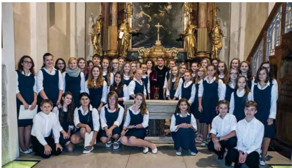
ČESKOBUDĚJOVICKÝ DĚTSKÝ PĚVECKÝ SBOR CANZONETTA Czech Republic, České Budějovice