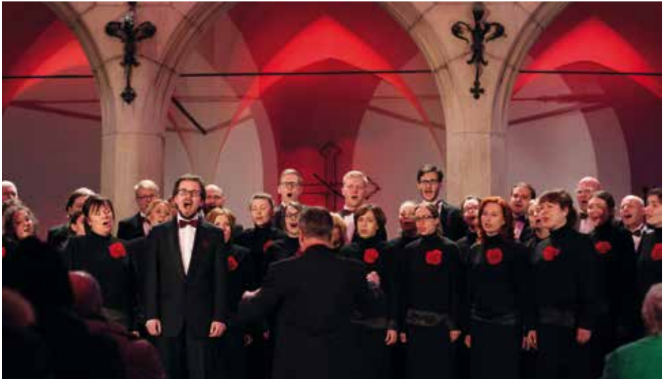
CHOR GDANSKIEGO UNIWERSYTETU MEDYCZNEGO Poland, Gdańsk