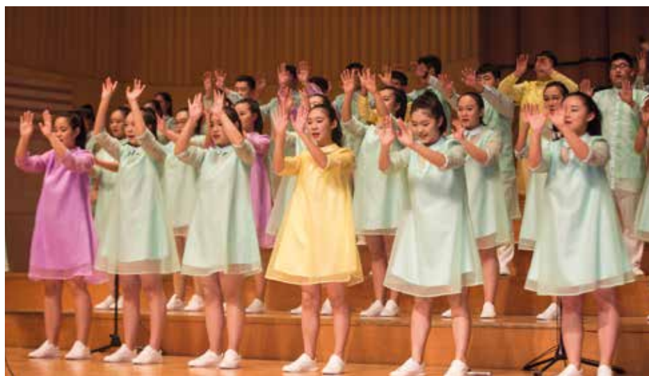
STARRY SKY CHOIR OF ZHENGZHOU MIDDLE SCHOOL NO. 19 China, Zhengzhou