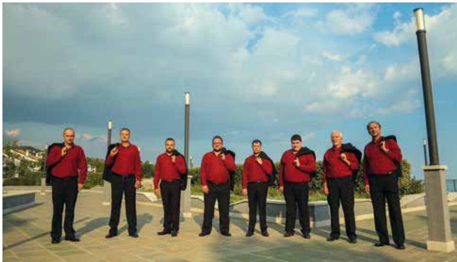
MALE VOCAL ENSEMBLE "KLAPA SKALIN" Croatia, Matulji