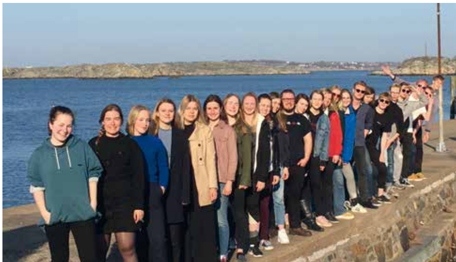
GUSTAVI UNGDOMSKÖR Sweden, Gothenburg